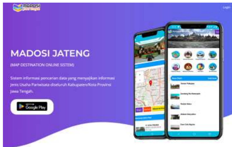
Gambar 3.1 Madosi Jateng

Aplikasi "Madosi Jateng" atau Map Destination Online Sistem Jawa Tengah merupakan aplikasi yang menyediakan informasi mengenai lokasi wisata, penginapan, tempat makan dan minum serta hiburan di kota tujuan. Aplikasi sistem informasi ini, menyajikan 13 jenis usaha pariwisata di seluruh kabupaten/kota di Jateng yang dapat mempermudah wisatawan untuk mengetahui posisinya dan dapat dengan mudah mengakses tempat-tempat wisata di Jawa Tengah. Layanan tersebut memungkinkan masyarakat bisa berselancar di dunia maya untuk mendapatkan berbagai jenis usaha pariwisata. Selain itu, wisatawan juga dapat memantau melalui ponsel, penyelenggaraan kegiatan hiburan dan rekreasi, penyelenggaraan pertemuan, perjalanan intensif, konferensi dan pameran, jasa informasi pariwisata, jasa konsultan pariwisata, jasa pramuwisata, wisata tirta, dan spa.